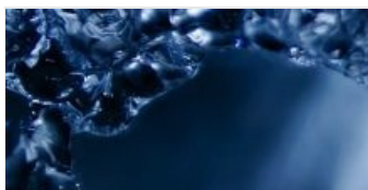
TRAVAUX ASSAINISSEMENT ET EAU POTABLE