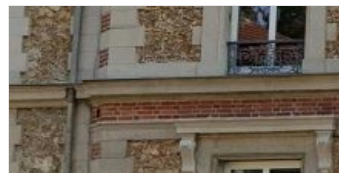
TÉLÉCENTRE LA FERTÉ- SOUS-JOUARRE