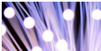
DÉPLOIEMENT DE LA FIBRE OPTIQUE