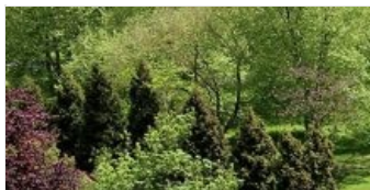
LA MAISON DES FROMAGES