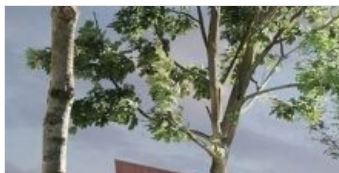
HALLE DES SPORTS